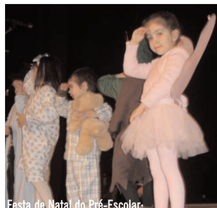
Festa de Natal do Pré-Escolar: Viagem à Terra do Peter Pan