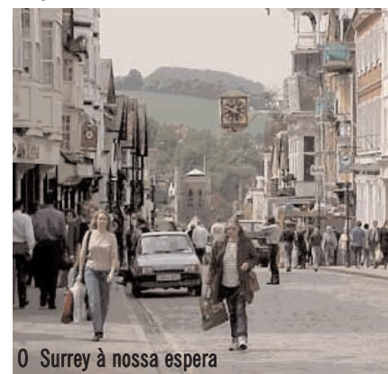
O Surrey à nossa espera