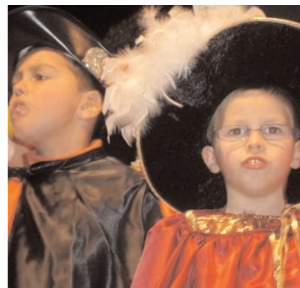
Festa de Natal do 1º Ciclo