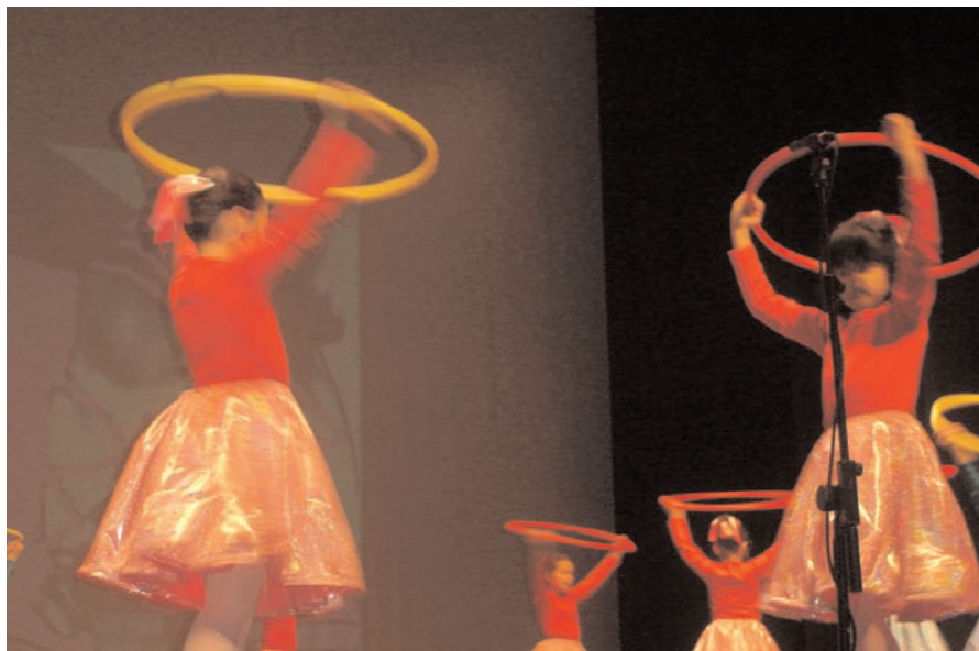
Festa de Natal do 1º Ciclo: O Natal através de “O Conto e a Fábula na Europa”