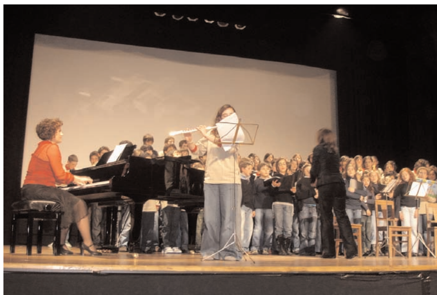
Audição de Natal da Escola de Música: canções de compositores europeus