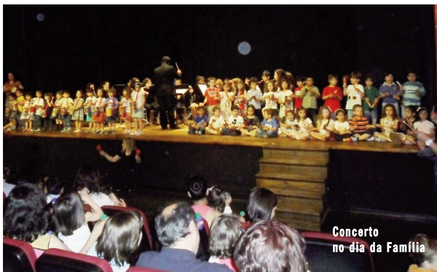
Concerto no dia da Família